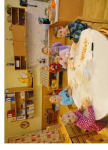
Foto vom Tag des Apfels 2012 Die Äpfel wurden gemeinsam geschält, geschnitten und anschl. zu einem Apfelstrudel verarbeitet und gegessen

Die derzeitigen Schwerpunkte sind: * viel Bewegung * gemeinsame Zubereitung einer gesunden Jause * Wasser statt Soft