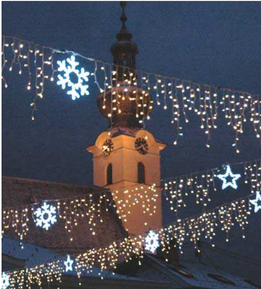
Im Bild die neue moderne LED-Weihnachtsbeleuchtung in Frankenburg, die vom Wirtschaftsforum Frankenburg-Redleiten angekauft wurde.