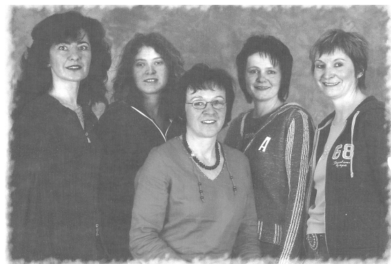
Das Team des Sonnenscheinkindergartens

Wir freuen uns auf eine erste Kontaktaufnahme mit Ihnen!