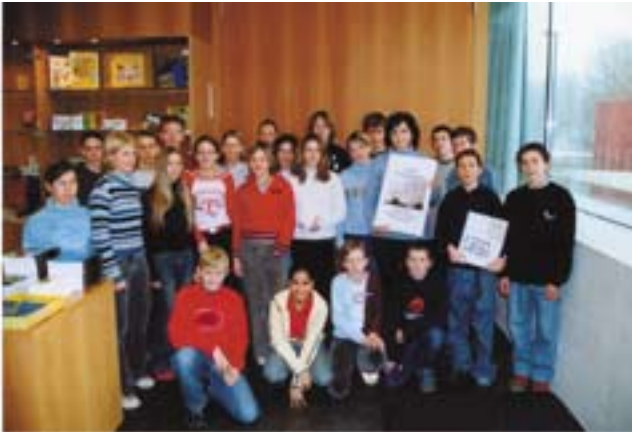
Die Schüler d. 3.B (Zeichenschwerpunkt) bei der Übergabe der Fotomappe im LENTOS

Im Rahmen eines Fotoprojektes fotografierten die Schüler der heurigen 3.B (Zeichenschwerpunkt) im Juni 03 das LENTOS - das neue Gebäude des Museums Moderner Kunst in LINZ. Das Gebäude wurde innen und außen aus den verschiedensten Blickwinkeln fotografiert. Nachdem die Fotos entwickelt und vergrößert waren, wurden zwei Mappen mit je 24 Fotos in der Größe von 20 x 30 cm gestaltet. Eine Fotomappe wurde beim letzten Besuch des LENTOS im Februar 04 der dortigen Leitung übergeben. Die zweite Fotomappe liegt in der Hauptschule zur Ansicht auf.