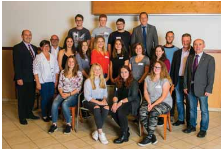
Jugendliche des Jahrganges 2000 folgten der Einladung der Marktgemeinde zur Jungbürgerfeier ins Gasthaus Preuner.