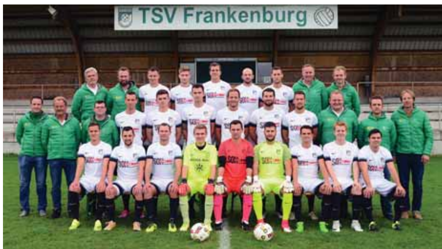
Die erste Mannschaft des TSV Frankenburg wurde Herbstmeister 2018.

https://vereine.fussballoesterreich.at/TsvFrankenburg/News/ Oder auf der Facebook-Seite: „TSV Frankenburg“