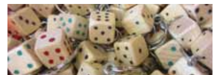
Diese Würfel als Schlüsselanhänger haben die Schüler als Damenspende vorbereitet.