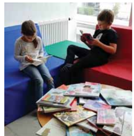
Die neuen Lesemöbel in der Volksschulbibliothek.

Ideal zum Lesen eignen sich die neuen Möbel in der Bibliothek der Volksschule Frankenburg, die der Ortsentwicklungsverein anschaffte. „Gemeinsam für Frankenburg“ fördert damit eine lesefreundliche Umgebung für die Einsteiger in literarische Abenteuer und ist überzeugt, dass die wirklich sehr einladenden Möbel zum Lesen anregen.