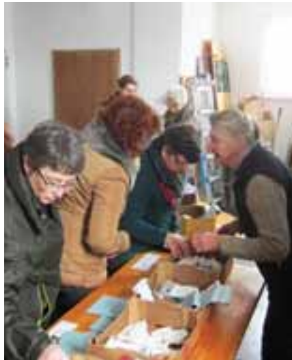
Stets großer Andrang bei der Frankenburger Saatgutbörse im Kulturzentrum.

Außerdem gibt es günstige Angebote aus der Biolinie von Samen Maier und natürlich Kaffee und Kuchen und Fachgespräche mit den GartenfachberaterInnen des Siedlervereins.