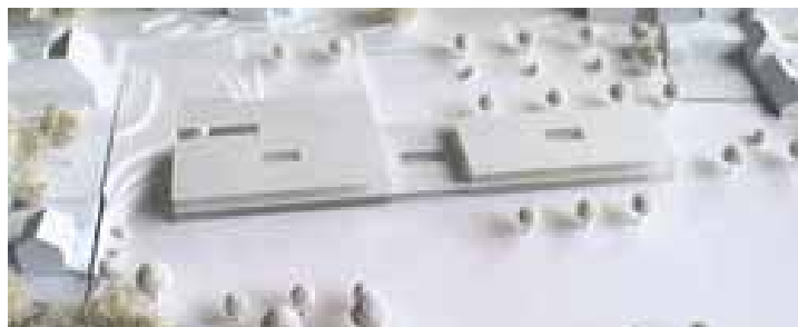
Die Nord- und Südansicht des Schulzentrums im Modell.

Das neue Schulzentrum stellt sich als ein langgezogener, zweigeschossiger Bau in Massivbauweise, der vermutlich auch Elemente aus Holz enthalten wird, dar. Das Gebäude passt sich an das pädagogische Konzept einer Cluster-Schule an, in der die Schülerinnen und Schüler in verschiedenen Gruppen wie auf einem Marktplatz arbeiten und sich für gemeinsame Aufgaben in Klassenzimmer zurückziehen können. Die Möglichkeit zur Umsetzung moderner altersgemäßer pädagogischer Konzepte war eine Voraussetzung für die Planer. Viele Räume sind mehrfach nutzbar, andererseits müssen einige technische Einrichtungen für beide Schulen nur einmal gebaut werden.