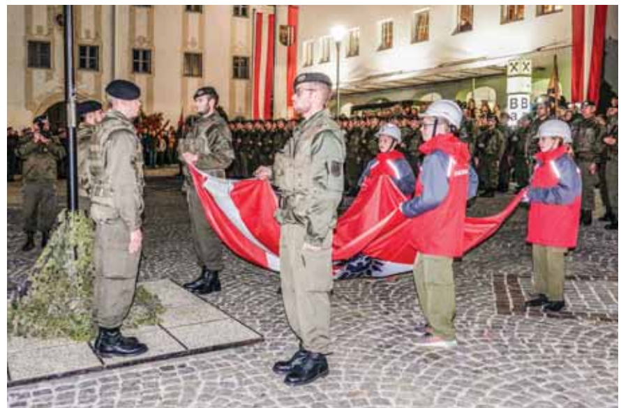
265 Grundwehrdiener, wurden am 9. November in Frankenburg angelobt. Gemeinsam mit Jugendlichen der Frankenburger Feuerwehren wurde feierlich die Fahne gehisst.