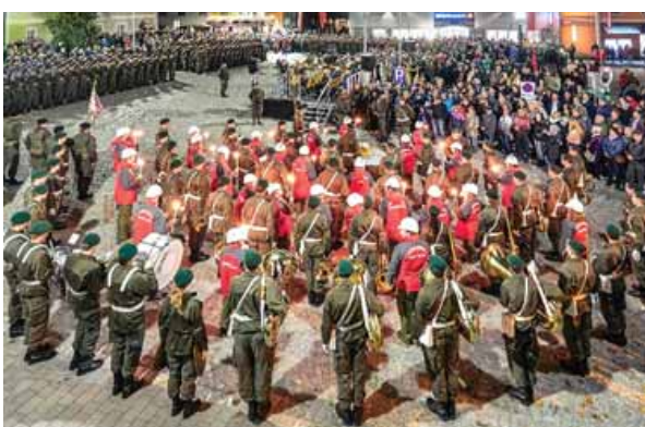
Einer der Höhepunkte im heurigen Veranstaltungskalender war die Angelobung der Rekruten der 4. Panzergrenadierbrigade mit der Militärmusik Oö. am 9. November auf dem neuen Marktplatz.