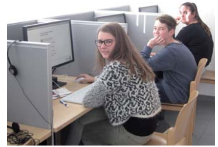
Bilder von der Berufsbildungswoche.