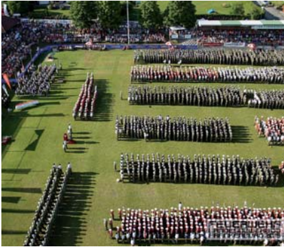
Bild von der Siegerehrung beim Landesfeuerwehrcamp.

Der Bezirks- und Landesfeuerwehrcamp, das 9. Marktfest und der 13. Würfelspiellauf mit Göblberg Mountainbike-Trophy haben uns weit über unsere Gemeinde- und Bezirksgrenze hinaus Lob und Anerkennung gebracht.