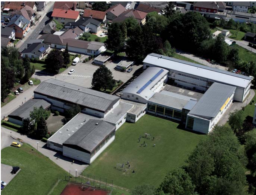
Im Bild das derzeitige Gelände unserer öffentlichen Schulen.

Budgetrahmen des Landes führte dazu, dass die Gemeinden unmissverständlich aufgefordert wurden, dass bei künftigen Umwidmungen der Gemeinde keine Aufschließungskosten entstehen dürfen (siehe Bericht zum Infrastruktorkostenbeitrag ) und auch alle möglichen Einnahmequellen (z.B. Wasseranschlusszwang im 50 m-Bereich der öffentlichen Wasserversorgung ) auszuschöpfen sind. Sollten diese Vorgaben nicht umgesetzt werden, kann dies unter Umständen auch zur Amtshaftungsklage gegen den Bürgermeister führen.