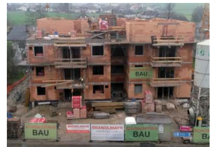
Die Robbauarbeiten am neuen GSG-Bau schreiten zügig voran.

Ein ganz besonderes Jahr war 2016 für unsere Marktgemeinde auch im Veranstaltungsbereich . Frankenburg konnte bei mehreren Großveranstaltungen abermals tausenden Gästen beweisen, wie mit Zusammenhalt und Organisationsgeschick (und natürlich auch mit großem Wetterglück) Enormes geleistet werden kann.