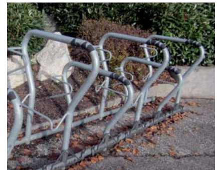
Fahrradständer der neuen Generation beim Kulturzentrum

Innerhalb der Gemeinde finden 4.000 Fahrten pro Tag statt. Nur 17 % der Wege innerhalb Frankenburgs werden zu Fuß erledigt und 10 % mit dem Rad. (Quelle: Land OÖ)