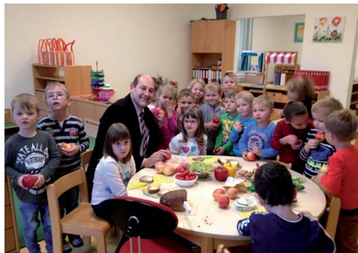
BGM Hans Baumann genoss im Rahmen des „Tages des Apfels“ eine „Gesunde Jause“ mit den Kindern in der neuen Gruppe im Sonnenscheinhaus.

Weiters konnten wir im November 2016 auf 10 Jahre „Essen zu Hause“ zurückblicken.