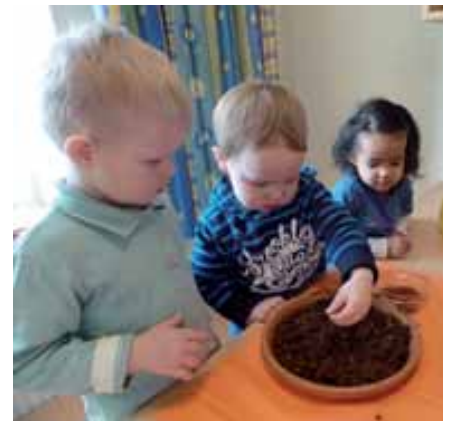
Bild: Beim Pflanzen der Kresse und anschließendem Beobachten wie diese wächst, lernen wir einfache Gesetze der Natur kennen.

Der Kindergarten Frankenburg erhielt von der Freiwilligen Feuerwehr Riegl vom Pfarrfrühstück im Dezember eine großzügige Spende für Spielmaterialien.