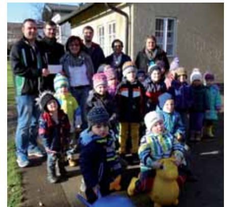
Bild: Die FF Riegl bei der Spendenübergabe.

Der Kindergarten Frankenburg erhielt von der Freiwilligen Feuerwehr Riegl vom Pfarrfrühstück im Dezember eine großzügige Spende für Spielmaterialien.