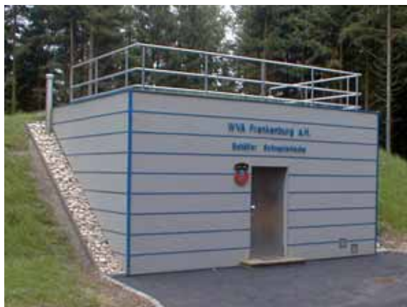
Bild: Hochbehälter in Ottokönigen.