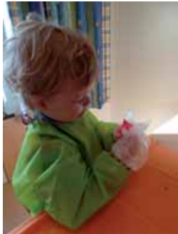
Bild: Unsere individuell gestalteten Ostereier sollen den Osterstrauch bunt schmü- cken.

Der Frühling hat sich bereits angekündigt und wir bereiten uns nun auf das Osterfest vor.