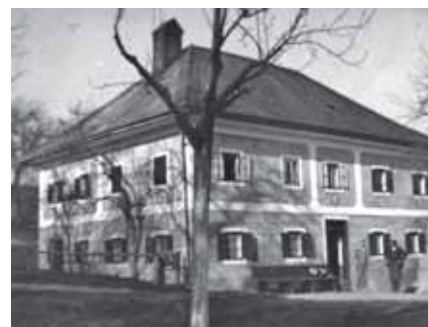
Bild: Angermühle, Lessigen

Der Heimatverein Frankenburg sucht für das nächste Buch im Rahmen der Edition Heimatgeschichte über die „ Mühlen und Sägen “ Fotos oder schriftliche Aufzeichnungen über die im Gebiet von Frankenburg, Redleiten und Zipf bestandenen Mühlen und Sägen.