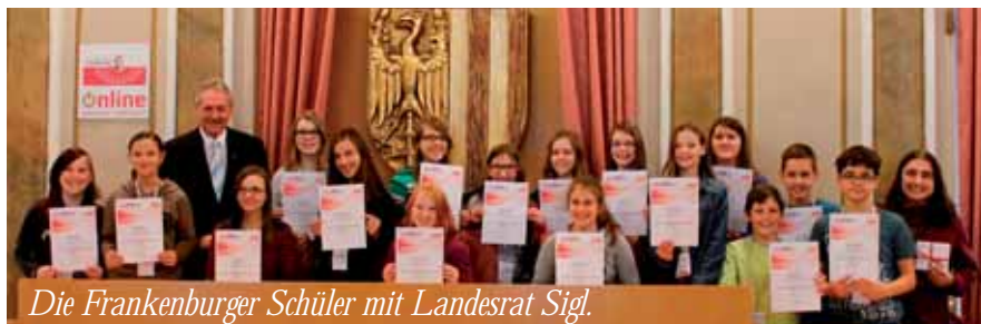
Die Frankfurter Schüler mit Landesrat Sigl.

Politik als trockene verstaubte Sache, die Jugendliche nicht berührt? Diese weit verbreitete Meinung wurde am 26.11.2014 kräftig widerlegt. Schülerinnen und Schüler der 2. Klassen machten sich auf, den OÖ Landtag mit all seinen Facetten kennenzulernen. Politik für junge Leute - ohne Hemmschwelle! Dieser Slogan wurde in einem abwechslungsreichen Workshop zielgerichtet und altersgerecht umgesetzt. In Kleingruppen wurden Medienbeiträge (über Bundesrat, Landtag...) erstellt, Straßeninterviews aufgenommen und Gespräche mit Vertretern aller im Landtag vertretenen Parteien geführt.