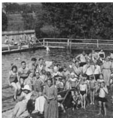
Bild: Freibad um 1932.