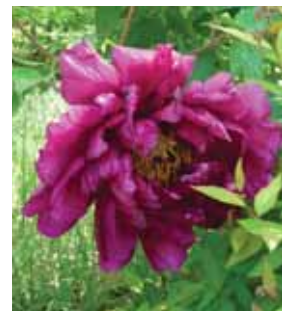
Bild aus dem Botanische Garten