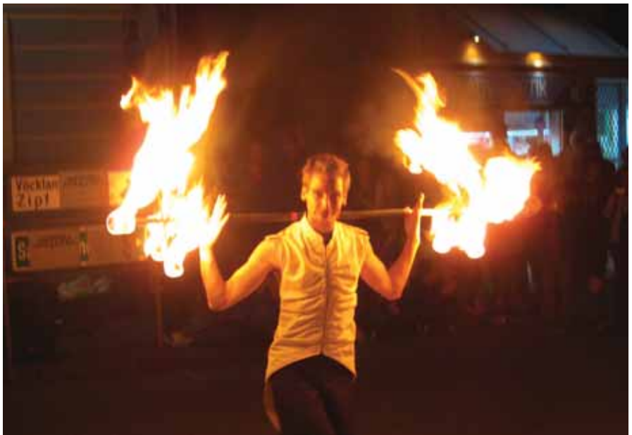
Bild: Der krönende Abschluss eines jeden Marktfestes ist die beeindruckende Feuershow der Gruppe Fenfire am Marktplatz.

Das Marktfestteam freut sich schon jetzt auf Ihren Besuch!