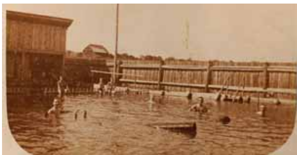
Bild: Freibad um 1910.