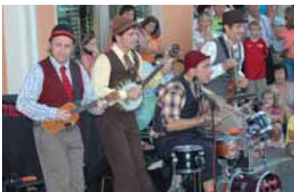
Bild: The von Trolley Quartet war auch schon zu Besuch am Marktfest.