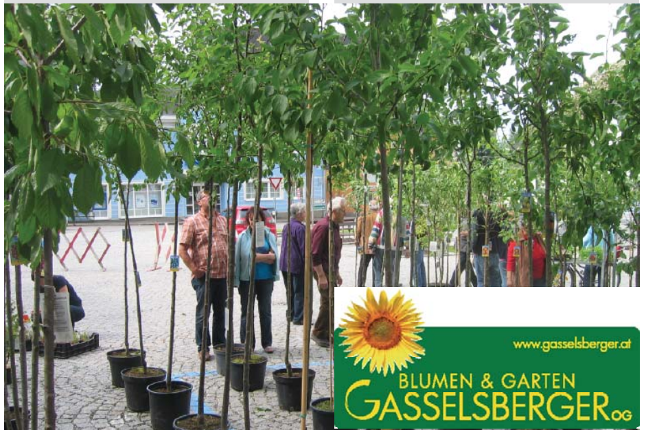
Obstbäume, Beerensträucher und Pflanzl gibt es beim Obstbaumkirtag am Marktplatz.

Gute Obstbaumsorten, Beeren und Pflanzl. Heimische Produkte.