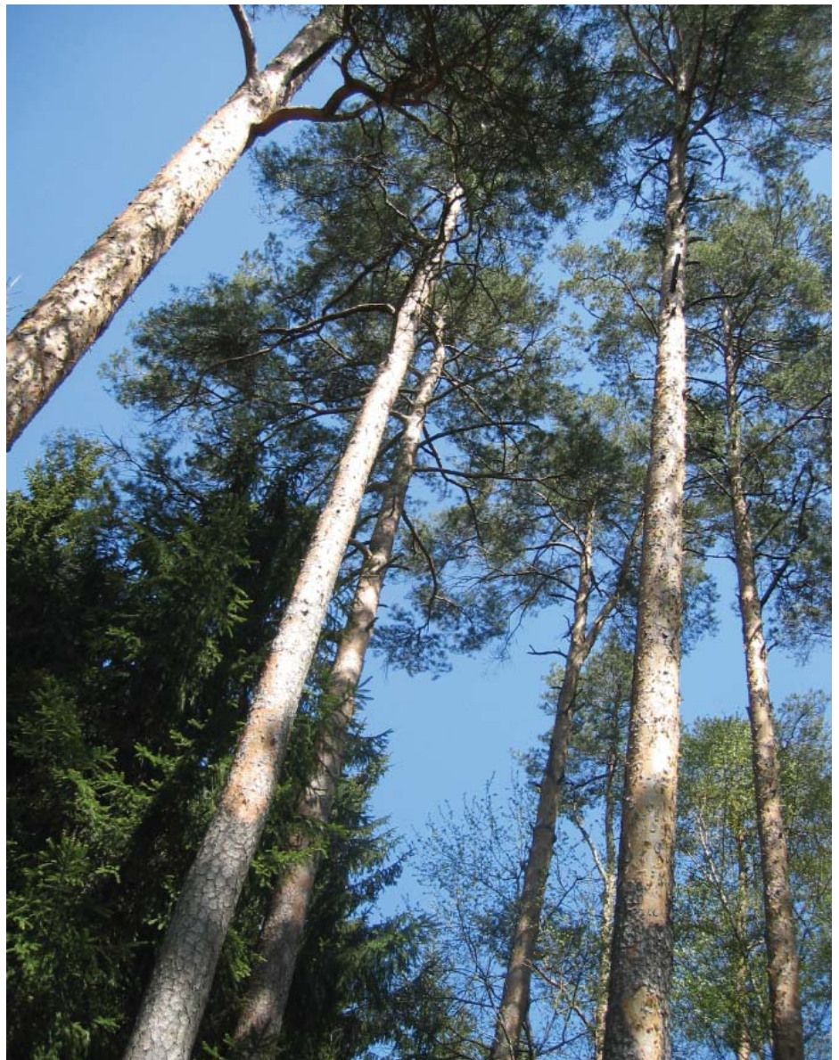
Erhaltenswerte Landschaften - Der Föhrenwald im Naturschutzgebiet Grünberg.

LANDSCHAFT SCHAFFT, WER MIT DEM LAND SCHAFFT