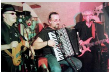
Die Spätzjünder. Blues - Rock - Crossover mit Mundarttexten, 60er, 70er und 80er Musik.

Donnerstag, 26. April, Vormittag Volksschule