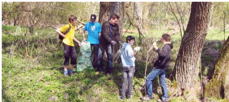
Da heuer keine Flurreinigung stattfindet, bitten wir alle, auf eine saubere Umwelt zu achten.

Die Schuld auf andere zu schieben, wäre zu einfach. Jeder trägt durch sein Verhalten zu der Umwelt bei, in der er lebt.